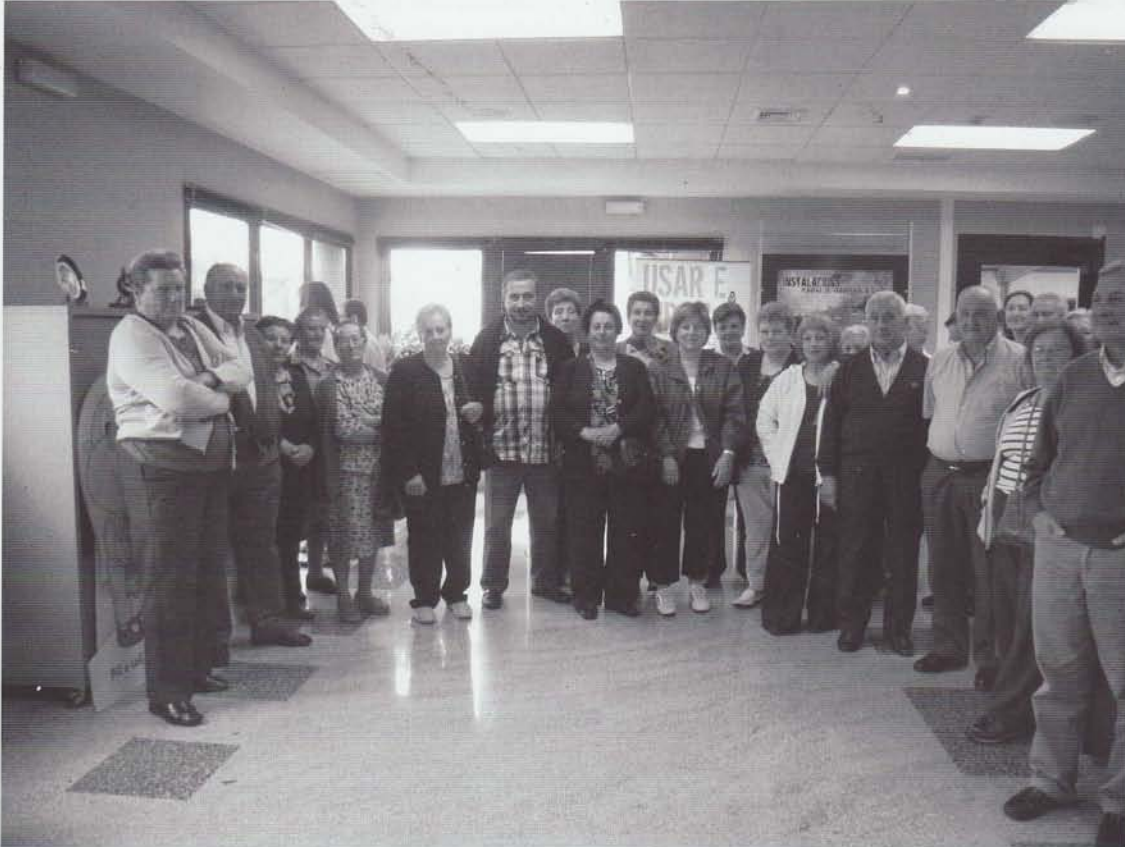
Veciños do concello de Sandiás nas instalacións de Sogama

O pasado 28 de xuño de 2012 os veciños de Sandiás desprazáronse ata o complexo industrial de Sogama en Cerceda (A Coruña) para comprobar o seu funcionamento e ampliar os coñecementos en torno á adecuada xestión dos residuos urbanos e os hábitos necesarios para reducir a súa xeración, ampliar a vida útil dos produtos e colaborar no sistema de recollida selectiva como garantía para facilitar a reciclaxe.