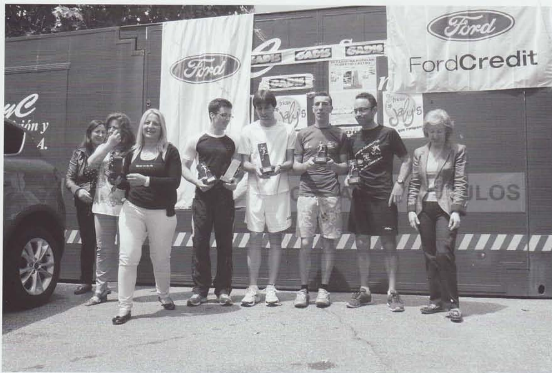
Os gañadores locais da III Carreira Popular Torre do Castro