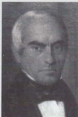
Retrato de Domingo Fontán (Portas (Pontevedra), 1788-1866)

Domingo Fontán (1788-1866). Galego Ilustre. Autor da Carta Xeométrica de Galicia (1854), o primeiro mapa topográfico de Galicia realizado con métodos científicos, colaborador do Dicionario Madoz, e Deputado a Cortes por Pontevedra polo Partido Liberal. Entre xuño e xullo de 1858 publicou unha serie de artigos no xornal semanal "La Exposición Compostelana" relacionados co fomento da agricultura en Galicia como "El fomento de la Agricultura", "La utilización de los juncales", "El saneamiento de Limia y de la tierra llana", "El poder público y fomento de la producción". A segunda parte do artigo relacionado co saneamento da Limia é o que reproducimos a continuación, artigo que se atopa na Biblioteca do Museo de Pontevedra.