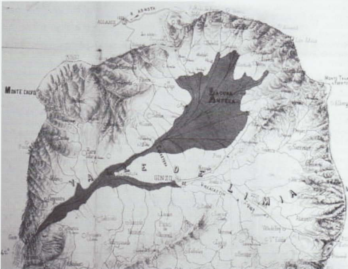
Plano da lagoa de Antela no proxecto de desaugamento de Toribio Íscar (1866).