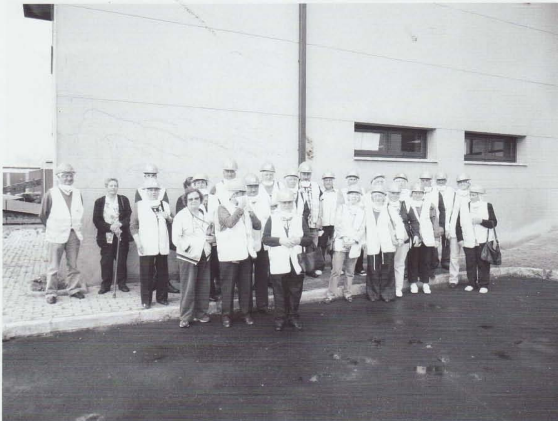
Un momento da visita dos veciños do concello de Sandiás ás instalacións de Sogama (Cerceda – A Coruña)

Ademais de todo iso, a correcta selección en orixe permitirá remitir ós centros recicladores importantes cantidades de residuos polas que os concellos non só non pagaran, senón que recibirán ingresos que poderán destinar a distintos servizos sociais.