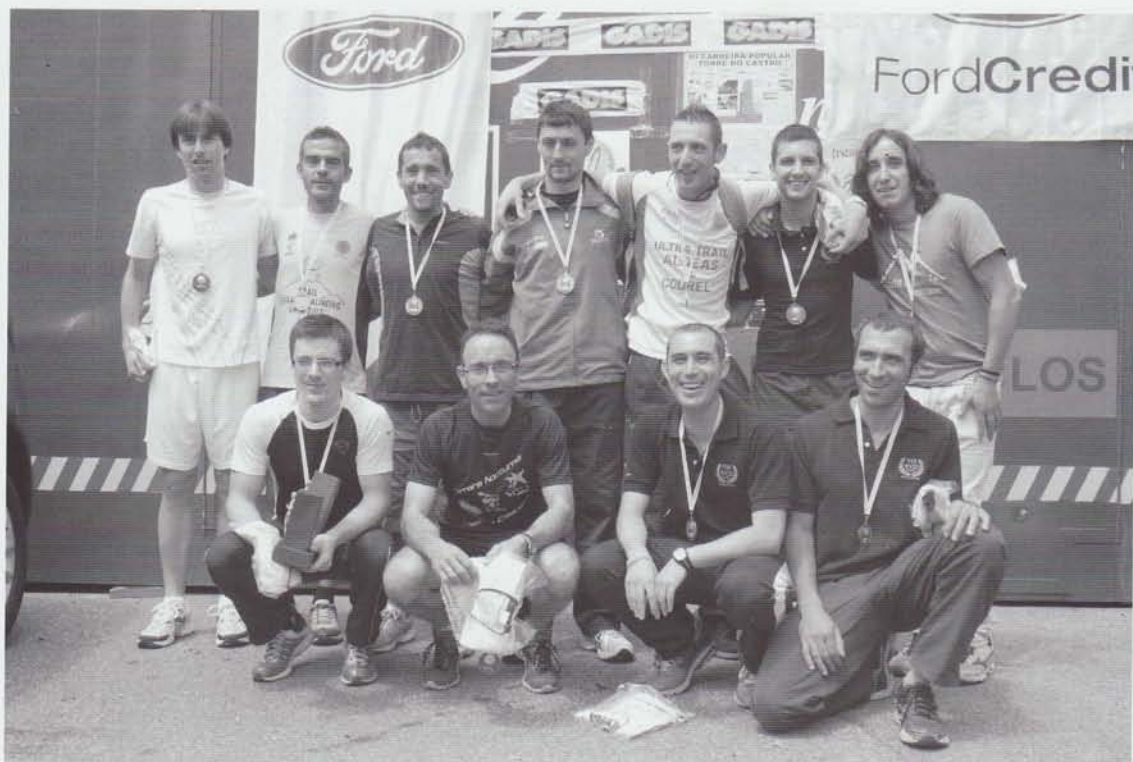
Os gañadores por equipos da III Carreira Popular Torre do Castro