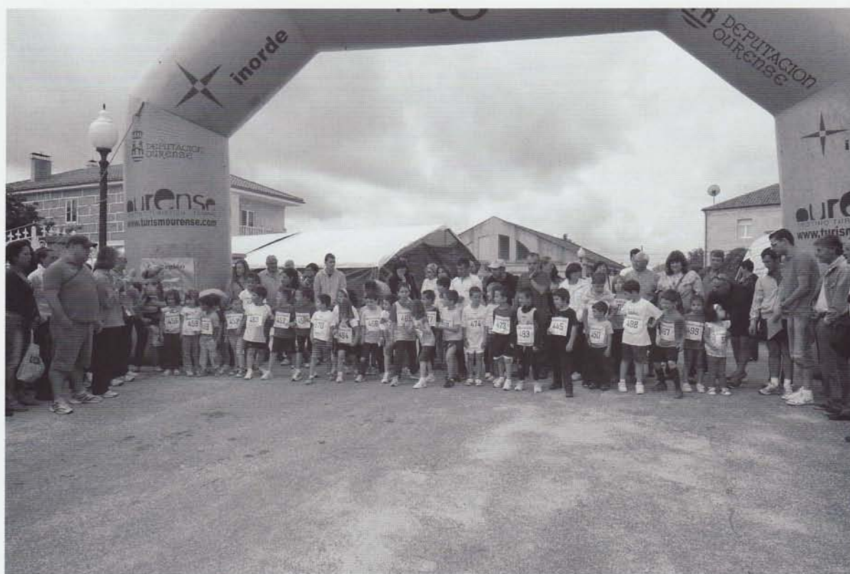
Saída da carreira dos "Pitufos"