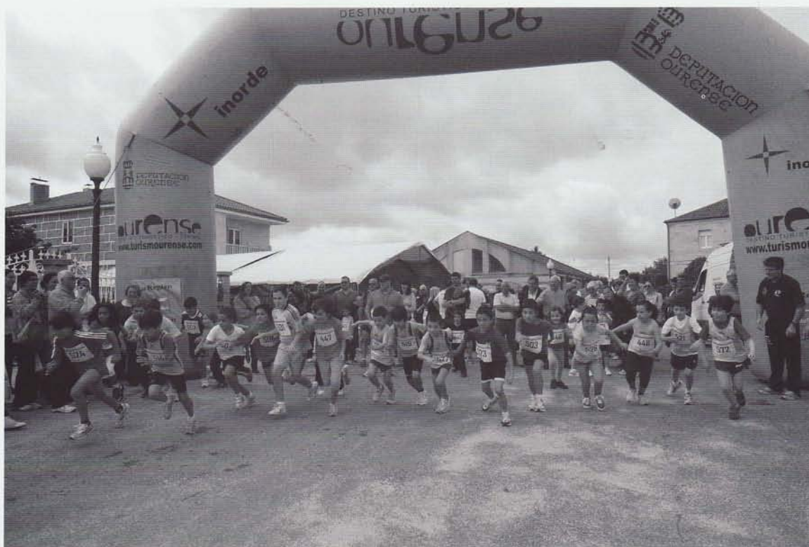
Saída da proba escolar