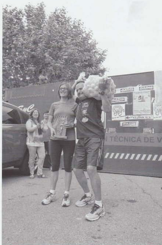
A gañadora na proba absoluta feminina cos seus premios (Trofeo e patacas)

Un ano máis, os comentarios máis repetidos polos atletas da proba absoluta, como xa é habitual, foron as enormes e pinas subidas, como se pode observar no perfil da proba, ata a capela do san Bieito da Uceira. Como xa é tradicional "os muros" da Uceira fixeron sufrir á maioría dos atletas. O éxito de afluencia, aínda máis xente que nas edicións anteriores, a satisfacción dos atletas pola carreira, e a gran colaboración dos negocios da comarca, moi necesaria nestes tempos de crise, fainos pensar na consolidación desta proba no calendario de carreiras populares de Galicia.