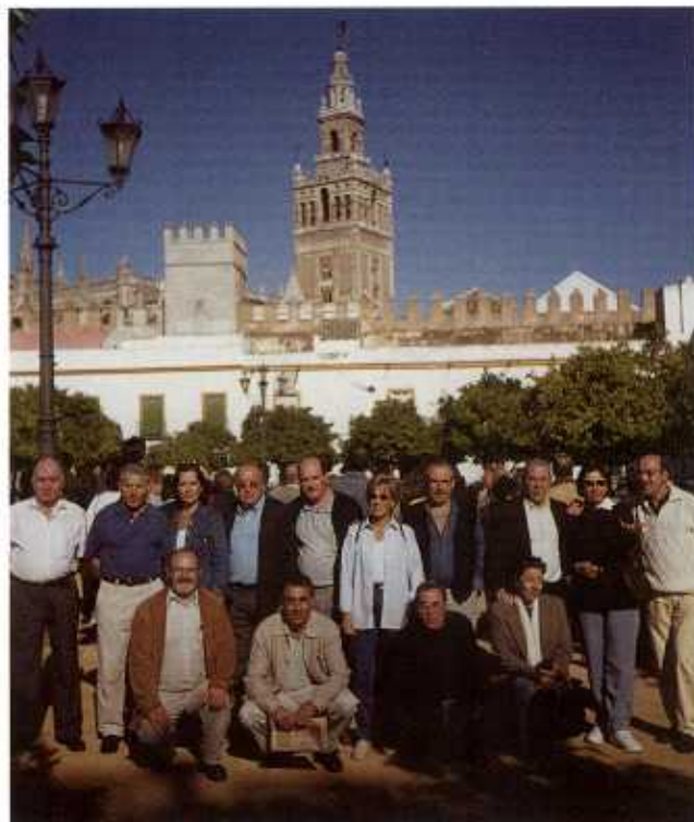
DE RUADA en Sevilla invitada polo Lar Galego da cidade hispalense

30 de decembro: Tradicional concerto de Nadal patrocinado pola Delegación de Cultura, na Basílica Catedral de Ourense.