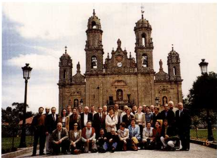
Actuación no Santuario dos Milagros no oitenta aniversario de Monseñor Araujo Iglesias

29 de abril: Actuación de DE RUADA na Universidade Laboral de Ourense, dentro dos actos conmemorativos do seu 25 aniversario.