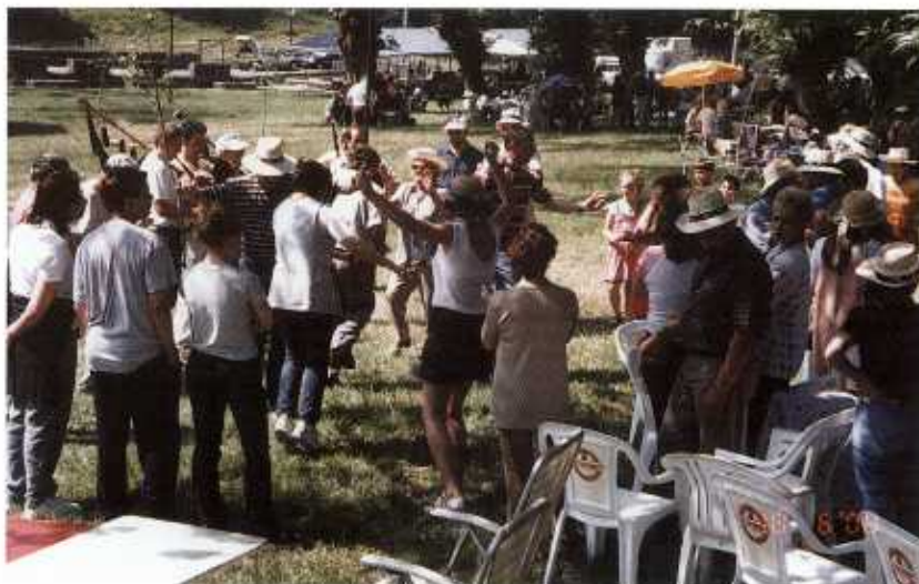
Romaria en Oseira